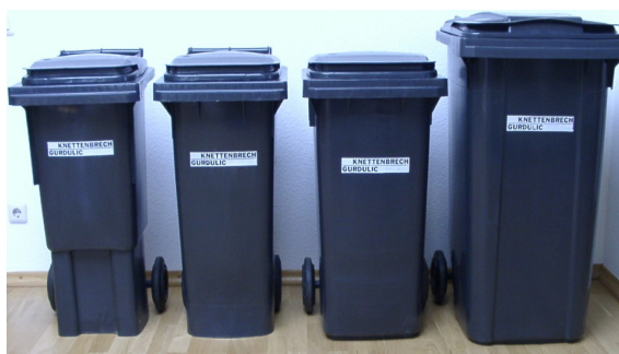
Gefäße für Rest- und Bioabfall

Die Antragsformulare zur Bestellung der Restabfallgefäße in den Größen 60, 80, 120, 240 und 1.100 Liter, sowie für Bioabfall in den Größen 60, 80, 120 und 240 Liter sind für Liegenschaftseigentümer und eingetragene Hausverwaltungen bei der Stadtverwaltung erhältlich.